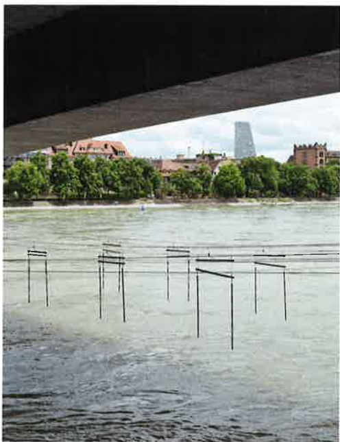
Im Schatten der Dreirosenbrücke. Die Stadtansichten des Fotografen Beat Aemmer führen durch dieses Heft.

Thomas Aemmer (1982) lebt in Interlaken. Er hat den Lehrgang Fotodesign an der Berufsschule für Gestaltung in Zürich absolviert. Seit 5 Jahren arbeitet er schweizweit als selbstständiger Fotograf mit Fokus auf Dokumentar-, Interior- und Architektur-Fotografie. Dabei stehen stets der Bezug zum Menschen oder dessen Wirken im Mittelpunkt. Alle seine Fotos vereint ein subtiler Hang zur Ironie. Uns hat besonders seine Bildstrecke «Künstliche Natürlichkeit» ( thomasaemmer.alloyou.net ) überzeugt, ihn mit dem Streifzug durch Basel zu beauftragen.