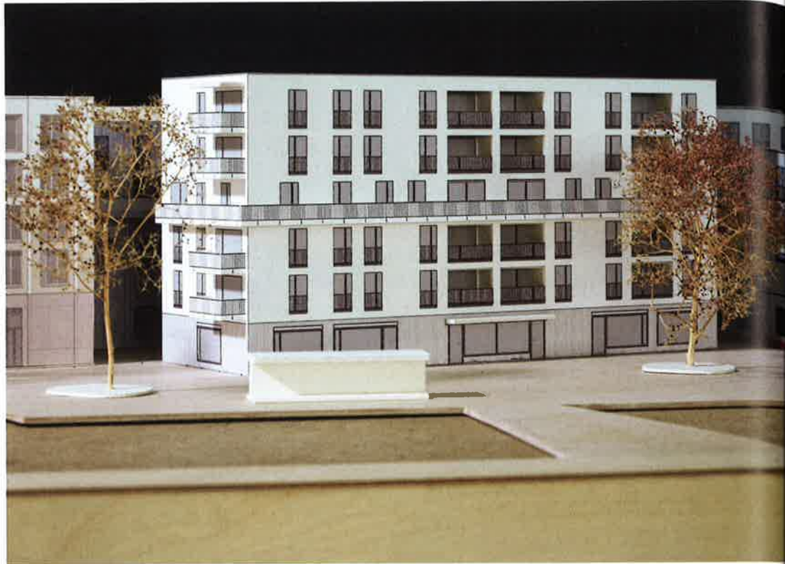
Kleinteiligkeit und durchmischte Nutzung versprechen eine lebendige Nachbarschaft in den Höfen (rechts) oder in den Mietwohnungen von Bau 2 von Atelier 5 (oben).

Atelier 5 Architekten und Planer, 2013 Nachhaltigkeit Nova Energie Basel / Zimraum Raum + Gesellschaft