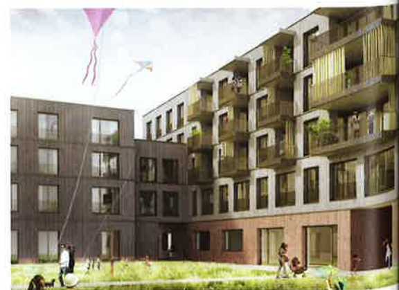
Betreutes Wohnen über der Kinderkrippe im Bau 1 von Galli Rudolf. Rendering: Atelier Brunecky, Zürich